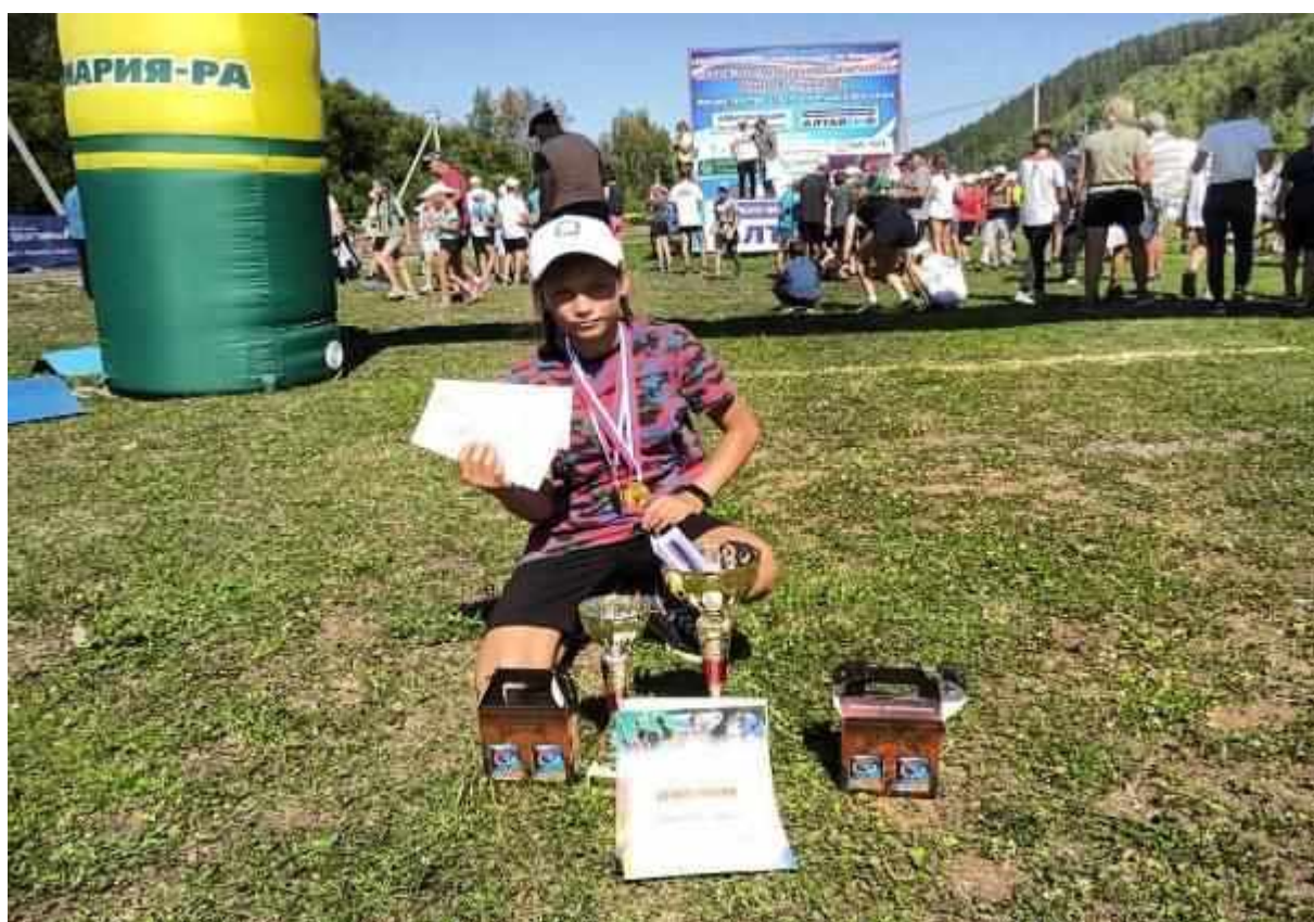
с. Алтайское 24-25 августа 2021 Первенство Алтайского края по биатлону «Кубок Олимпийского чемпиона Сергея Тарасова»

По итогам 2021 года на территории Солтонского района активно ведется физкультурно – спортивная и массовая работа. Не смотря на снижение